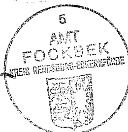
Hinrichs Büroleitender Beamter